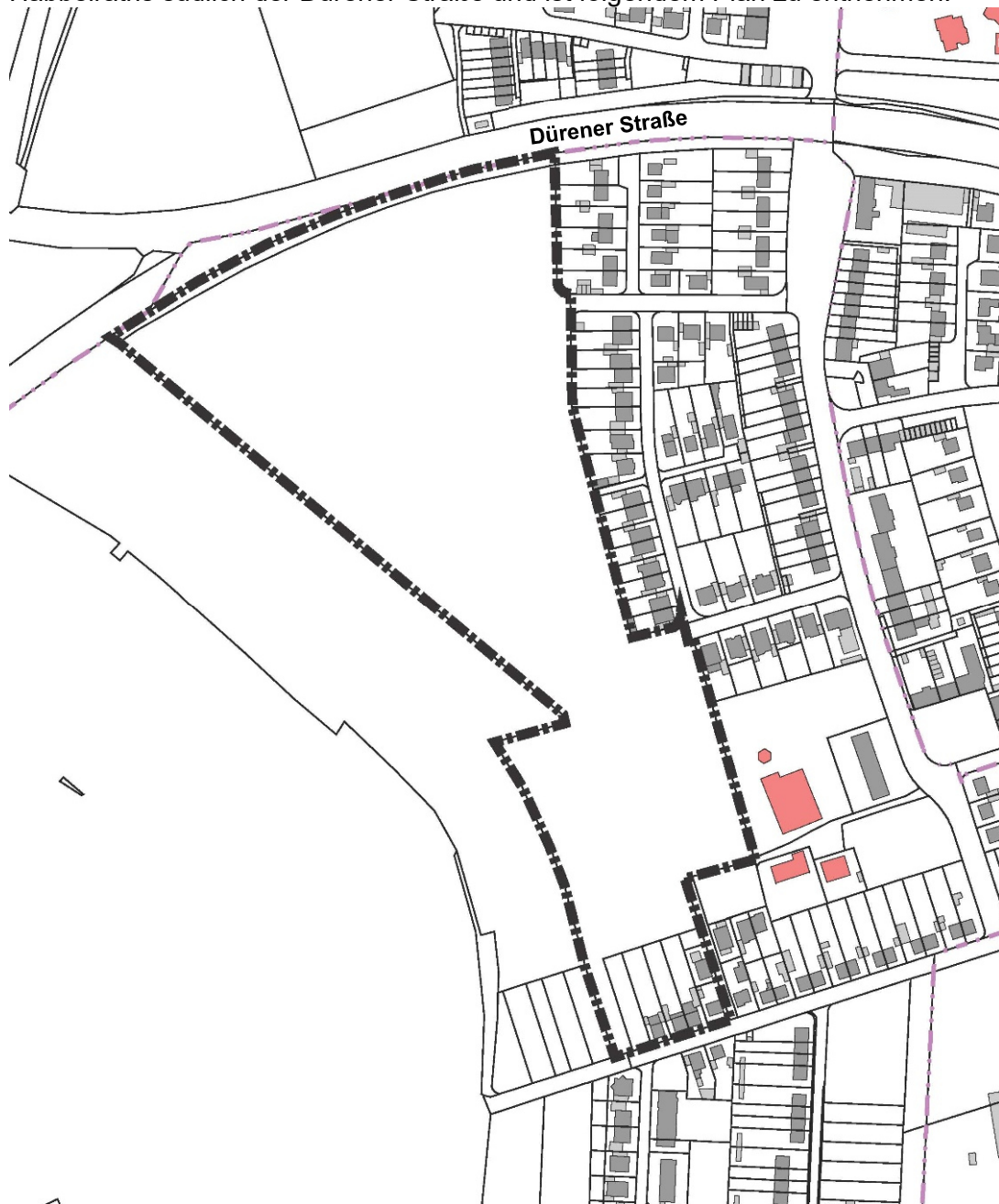
Abb.: Räumlicher Geltungsbereich des Bebauungsplans Nr. 3.10 HA „Ammerstraße / Im Kappesfeld“ (ohne Maßstab)

Der räumliche Geltungsbereich des Bebauungsplans befindet sich am westlichen Ortsrand Habelraths südlich der Dürener Straße und ist folgendem Plan zu entnehmen: