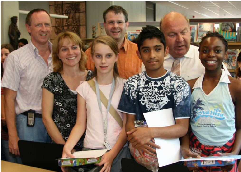
Drei Gewinner des Sommerleseclubs mit den meisten gelesenen Büchern

Der Bestandsumbau hat seinen Tiefpunkt erreicht. In mittelbarer Zukunft pendelt sich der Bestand zwischen 45.000 und 50.000 Medien ein. Dies unter der Voraussicht, das die wirtschaftlichen Gegebenheiten kontinuierlich bleiben.