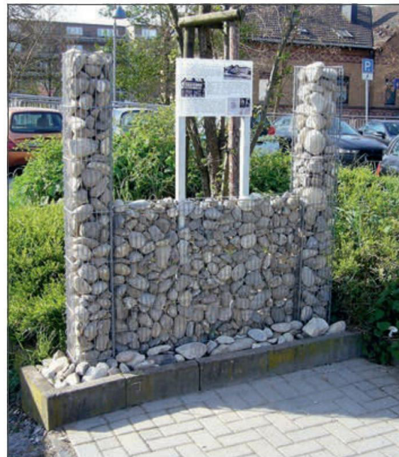
Abb. 10: Gabionenwand, 22.04.2010.

Schon gleich nach der Aufstellung verursachten ein Ausbau der Aachener Straße und die Anlegung einer Bushaltestelle vor der Gedenktafel neue Probleme um den Standort. 35 Das Umfeld um die Gedenktafel machte weiterhin einen unwürdigen Eindruck. 36 Hinzu kamen ständige Beschwerden aus der Bevölkerung und in der Presse zu dem immer mehr verkommenden Bahnhofsgelände einschließlich des denkmalgeschützten Bahnhofs. Die Verantwortlichkeit wurde in den veröffentlichten Berichten wechselseitig auf die Deutsche Bahn, die unterschiedlichen Abteilungen der Stadt, die Eigentümer des Bahnhofsgebäudes oder nicht aufzuklärenden Vandalismus geschoben. 37