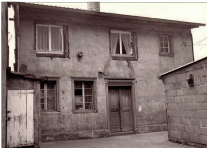
Abb. 4: Synagoge Frechen 1802-1803.