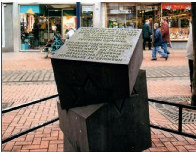
Abb. 5: Alte Synagoge Erinnerungsstein Hauptstraße.