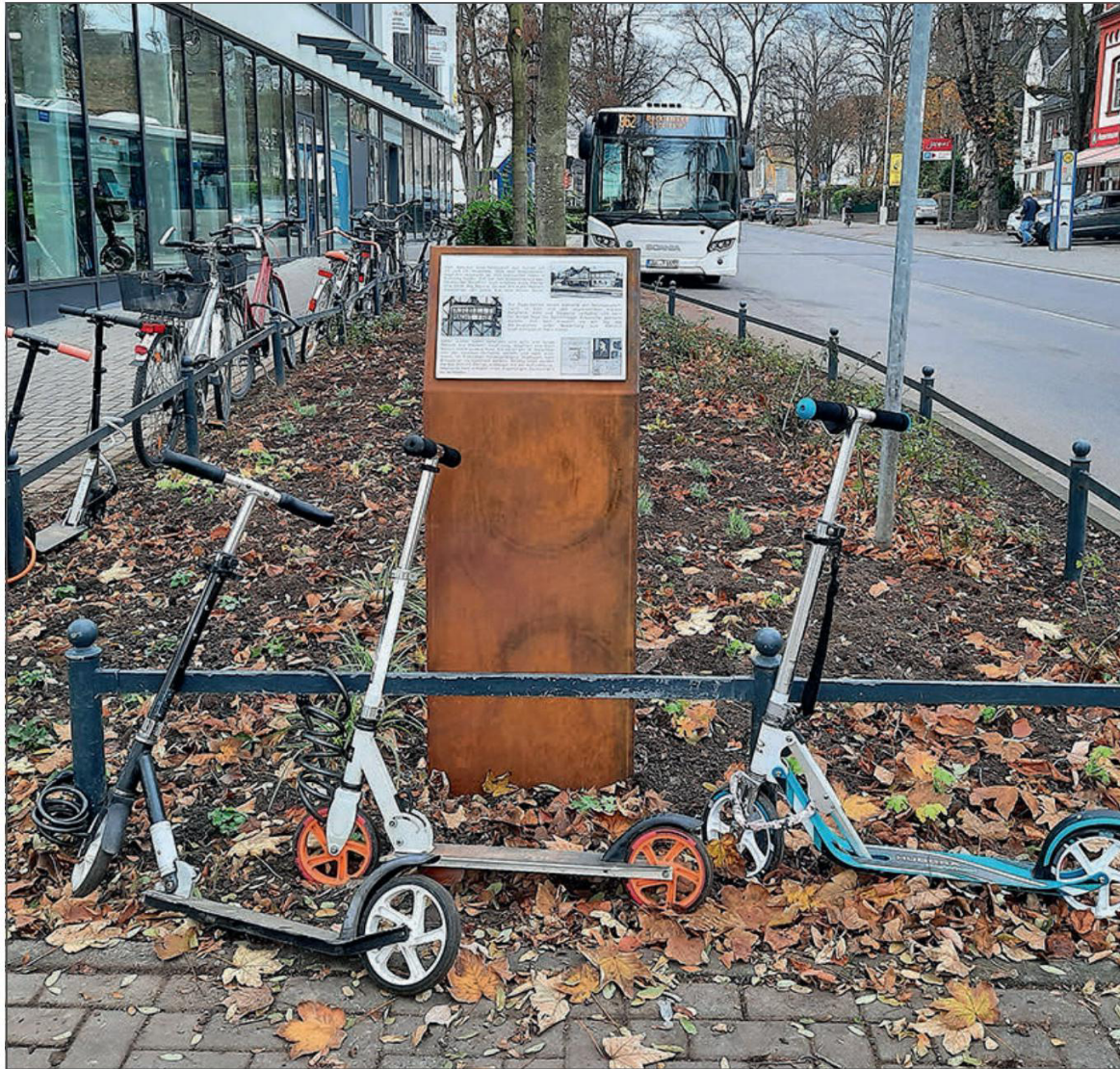
Abb. 11: Gedenktafel Enthüllung 13.11.2020.

Am 13.11.2020, dem Jahrestag der Deportation, wurde die Gedenktafel wegen der Pandemie ohne Beteiligung der Öffentlichkeit enthüllt. Ob eine offizielle Übergabe 2021 nachgeholt wird, war bei Redaktionsschluss offen.