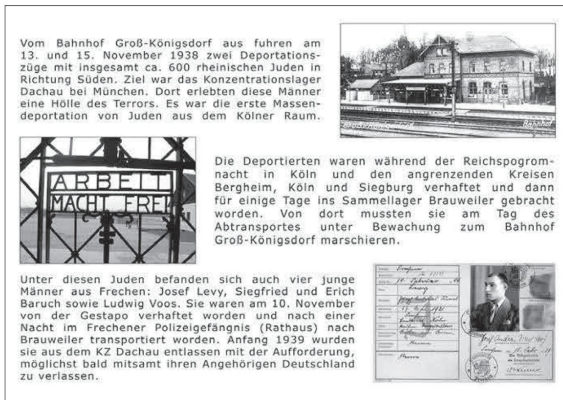
Abb. 1: Gedenktafel November 1938 Stadt Frechen

2018 waren es zehn Jahre her, dass auf dem Königsdorfer Bahnhofsvorplatz eine Gedenktafel errichtet wurde, die an zwei schicksalhafte Tage vor achtzig Jahren zur Zeit des selbsternannten Tausendjährigen Reiches 2 erinnert. 3