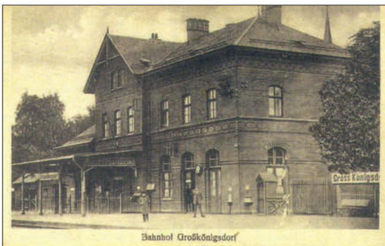
Abb. 3: Neues Bahnhofsgelände von 1891.

Im Jahr 1841 wurde die „Nebenstation Erster Klasse“ eröffnet. 5 2021 jährt sich zum 130. Mal, dass das erste Bahnhofsgelände durch ein neues ersetzt worden ist, das bis 1991 seinen Dienst tat.