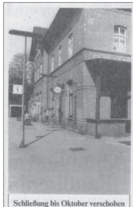
Abb. 8: Bahnhof, Schließung.

Parallel dazu stellte sich die Frage nach einem würdigen Standort. Passend wäre es gewesen, die Tafel an dem Bahnhofsgebäude selbst anzubringen. Es hatte zwar 1991 seine Funktion für die Bahnstation verloren und war verkauft worden, sollte aber erhalten bleiben und war deshalb zuvor noch unter Denkmalschutz gestellt worden. 30 Allerdings war das Gebäude schon vor 2008 in kritischem Zustand, auf den vor allem die Lokale Agenda und einzelne Bürger, darunter immer wieder der Autor, hingewiesen haben. 31 Für den Bürgermeister, der sich persönlich sehr bei der Suche nach einem Standort engagiert hatte, und den Autor war schnell klar, dass das Bahnhofsgebäude als Anbringungsort ungeeignet wurde, weil es zwischenzeitlich als Bordell genutzt wurde. Versuche, über den Denkmalschutz eine angemessene Gestaltung und Nutzung des Bahnhofsgebäudes zu erlangen, schlugen fehl. 32