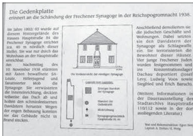
Abb. 6: An der Synagoge, Informationstafel.