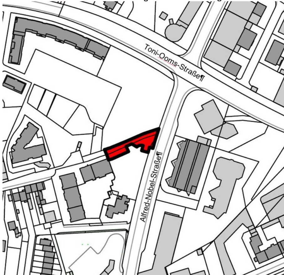
Abb.: Räumlicher Geltungsbereich des Bebauungsplans Nr. 38.1+2 F, 6. Änderung (ohne Maßstab)

Die Grenze des räumlichen Geltungsbereiches ist folgendem Plan zu entnehmen: