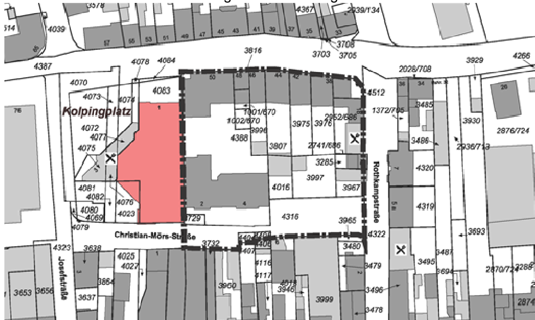
Abb.: Räumlicher Geltungsbereich des Bebauungsplans Nr. 18.2 F, 2. Änderung

Die Grenze des räumlichen Geltungsbereichs ist folgendem Plan zu entnehmen: